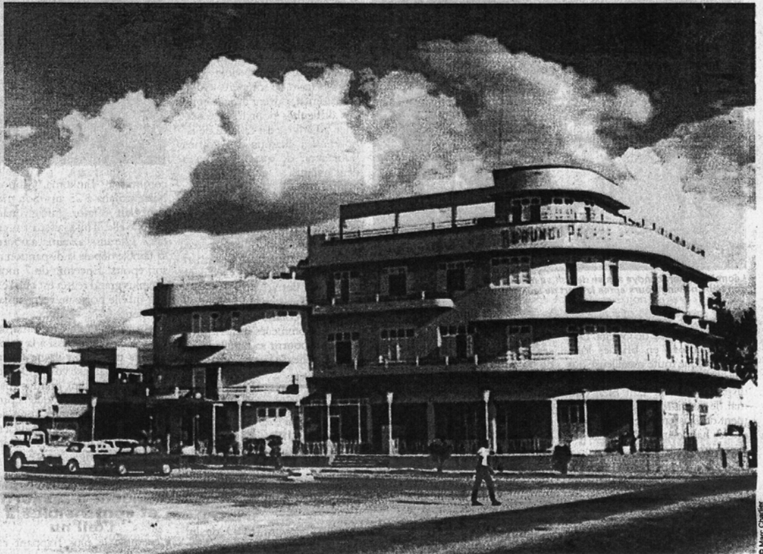
Au centre de Bujumbura, se dresse l'incontournable Burundi Palace : lignes épurées, balcons avec angles ronds, décoration sobre avec quelques lignes colorées, ... le style Bauhaus.