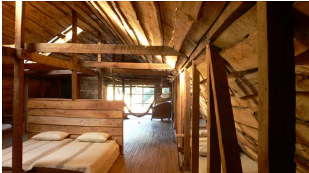
Galoft, galpón principal