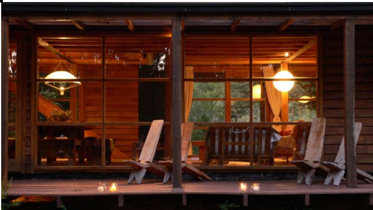
Casa Santa María