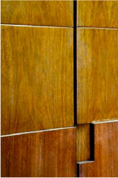
Open Office Bash