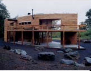
Casa del Silencio